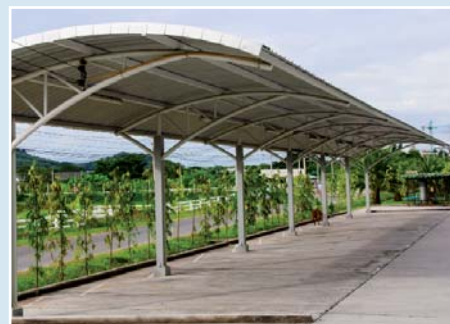
Cubiertas de Estacionamientos Solares