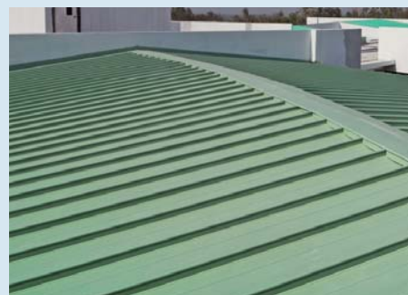
Union Sostenida de Pendiente Empinada

2590 Walsh Avenue, Santa Clara, California 95051, USA 1.408.919.5700 sales@miasole.com www.miasole.com