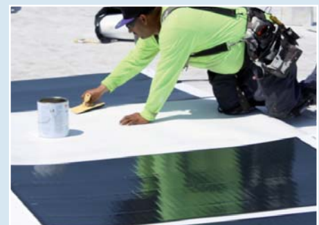
Limpia y Prepara el TPO