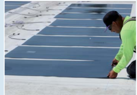
Extiende los Módulos